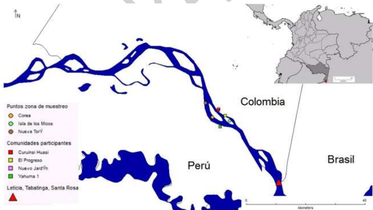
Figura 1: Área de estudio, playas y comunidades involucradas en el desarrollo del proyecto de conservación.

El trabajo se realizó en las playas Nuevo Torí (3°59' Sur; 70°10' Oeste), Corea (4° 1' Sur; 70°10' Oeste) e Isla de los Micos (4° 1' Sur; 70° 7' Oeste), a lo largo de 7 km del cauce del río. Las comunidades que participaron en el desarrollo del proyecto son, por parte de Colombia y pertenecientes al Resguardo indígena de Santa Sofía: Nuevo Jardín, El Progreso y la Asociación Curuinsi Huasi; por parte de Perú: Yahuma 1 (Figura 1). Adicionalmente, alrededor de las playas se encuentran las siguientes comunidades: colombianas, Santa Sofía y Yaguas; peruanas, Yahuma II, Barranco y Puerto Alegre; las cuales no participaron de los monitoreos.